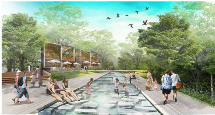
คลอง เชื่อมหน้าบ้าน สู่พื้นที่กิจกรรมของทุกคน สร้างสรรค์ประสบการณ์การเรียนรู้