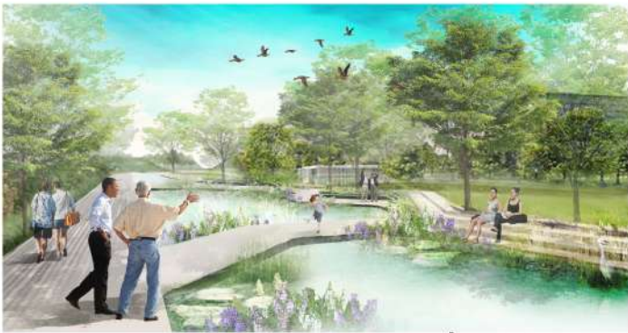
คลอง เชื่อมธรรมชาติ สู่การท่องเที่ยวเชิงนิเวศน์ สร้างสรรค์สิ่งแวดล้อมยั่งยืน